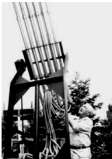
2. Le Cloudbuster de W. Reich